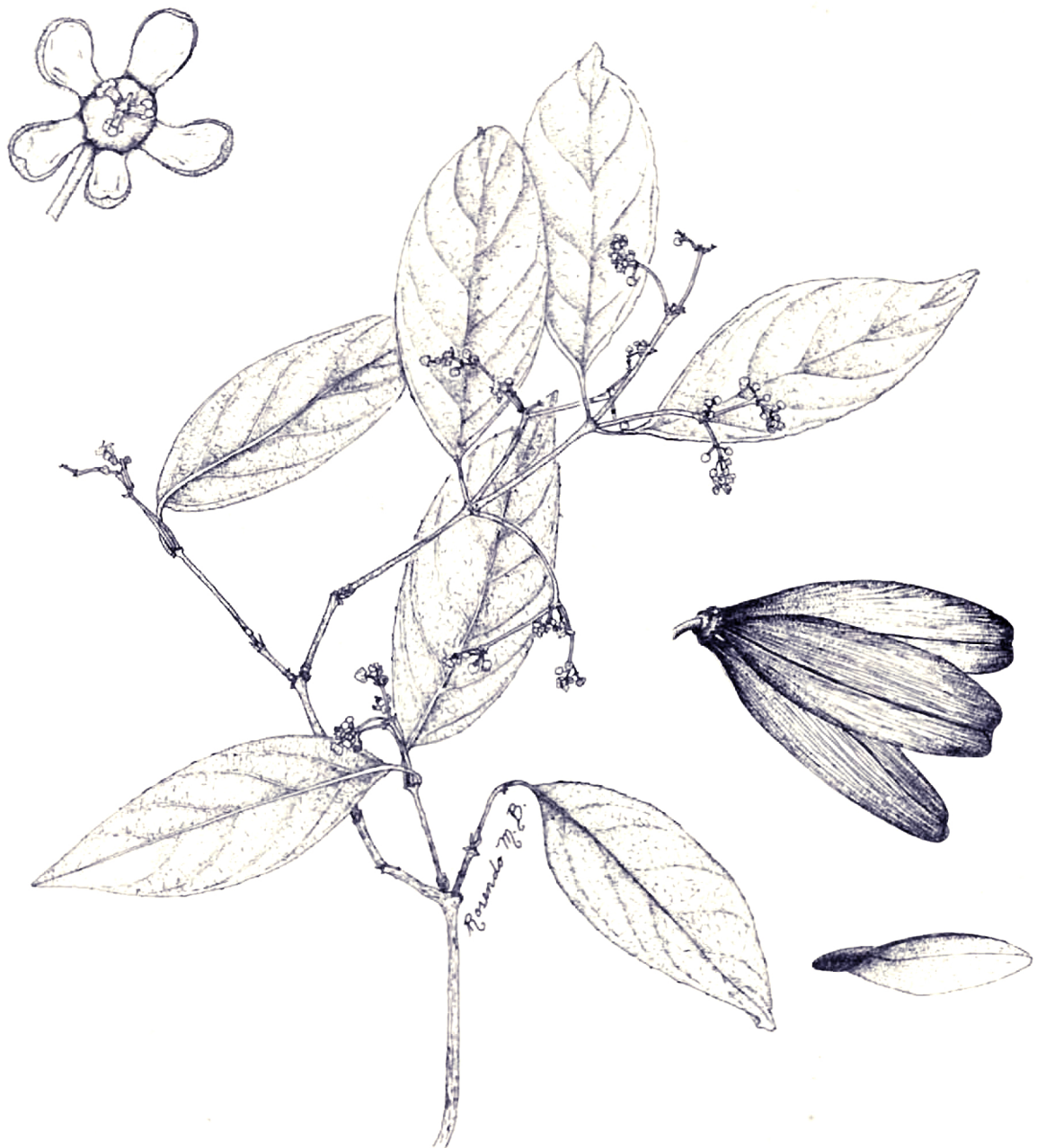
Hippocratea volubilis . a) Rama con flores. b) Detalle de la flor. c) Fruto. d) Semilla. Basado en C. Verduzco 317 y en A. Carter y Chisaki 1185.